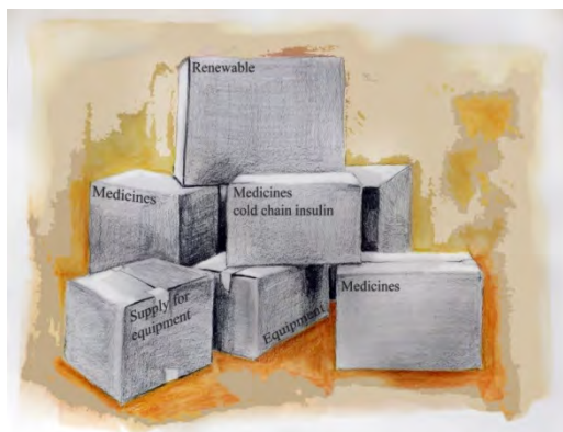
Table 1: Basic NCD kit modules with estimated weight and volume

The basic NCD kit consists of five submodules that can be ordered independently, depending on the needs, logistics and resources of the field (see Table 1 for the weight and volume of each of the five submodules). Modules (1a) to (1c) are renewables and therefore are design to last three months and cover a population of 10 000 people. Module (1e) is equipment and could last longer. Module (1d) contains renewables for the equipment in Module (1e). Module (1b) procurement requires the availability of an adequate cold chain.