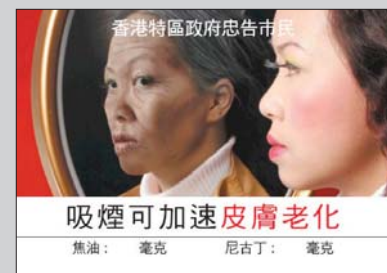
Chine (Hong Kong SAR)